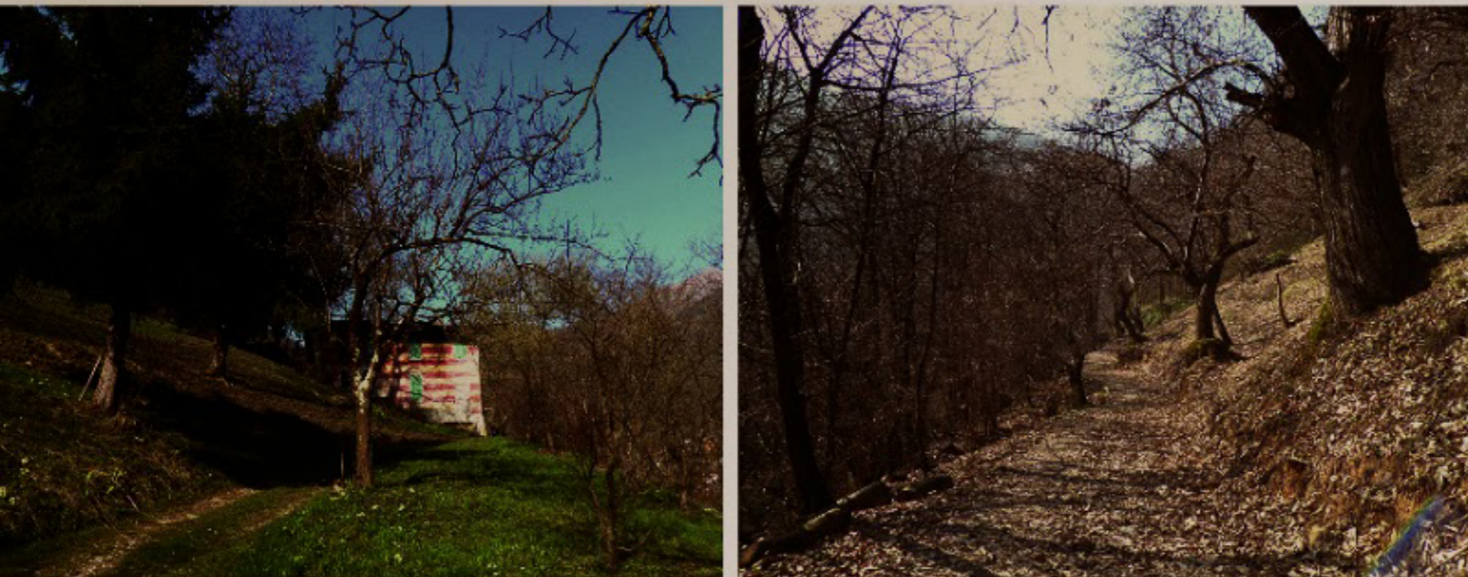
Foto sul percorso di gara

DEPOSITO BORSE - SPOGLIATOI DOCCE STAND GASTRONOMICO APERTO A TUTTI